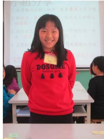
品格村自我介紹活動