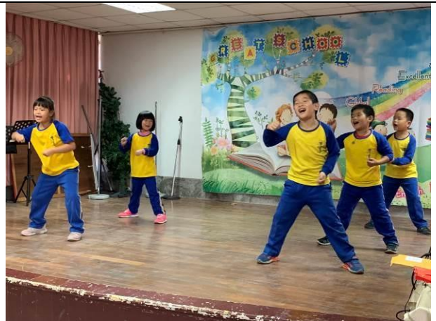
歲末感恩活動-低年級健康操表演