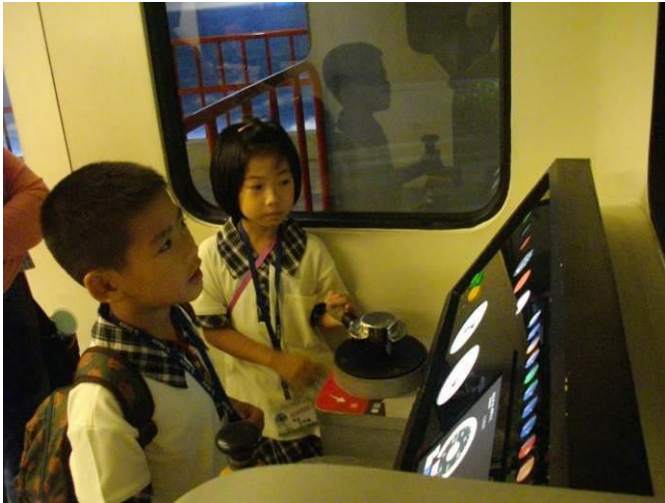
高雄科學工藝博物館~校外教學~開火車體驗