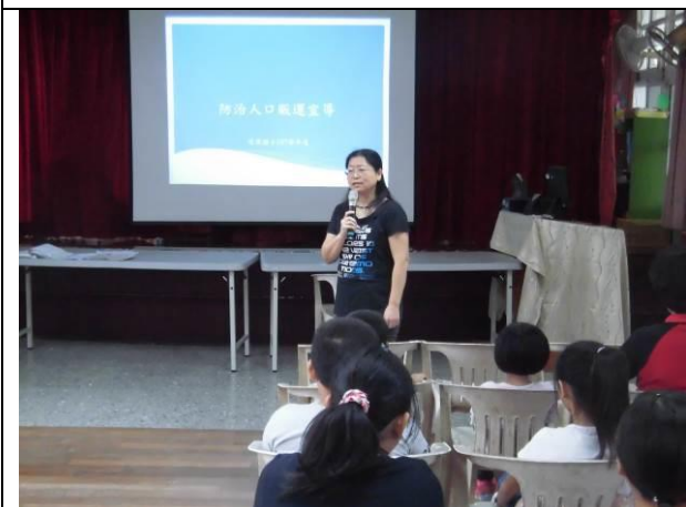
防治人口販運宣導