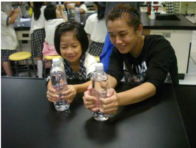
高雄科學工藝博物館~校外教學~製作小烏賊