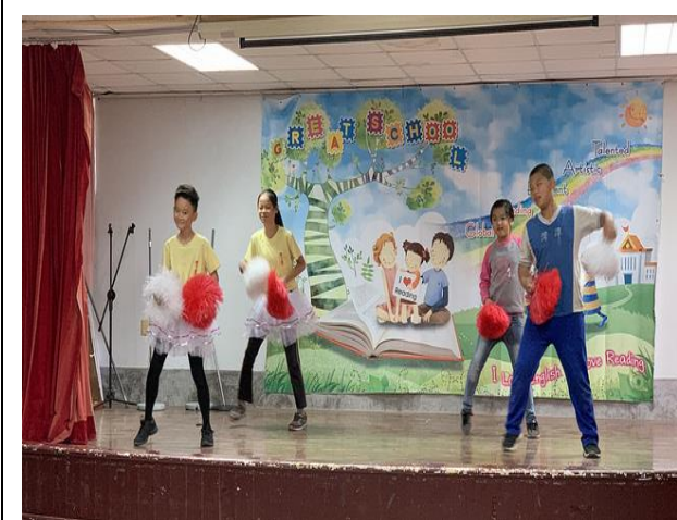
模範生競選助選團隊跳舞