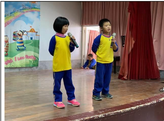
歲末感恩活動-一年級經詩唱誦表演