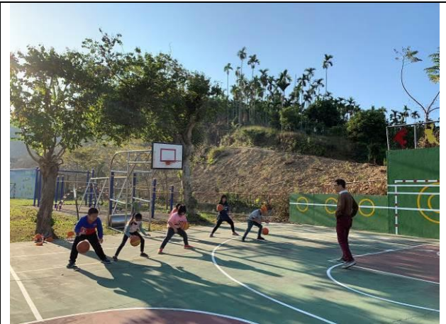
每週四運動社團-中年級