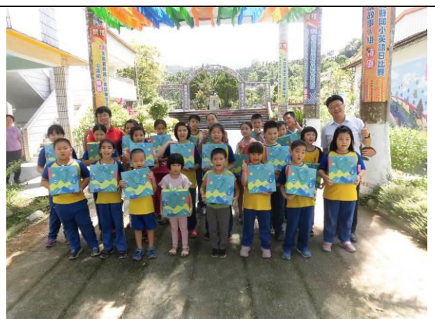
善心人士捐贈喜憨兒中秋月餅