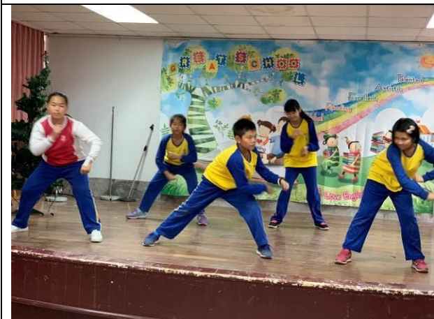
歲末感恩活動-六年級舞蹈表演