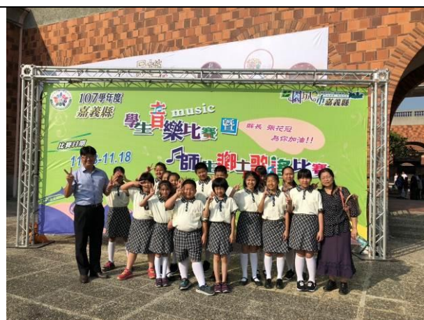
107學年度學生音樂比賽