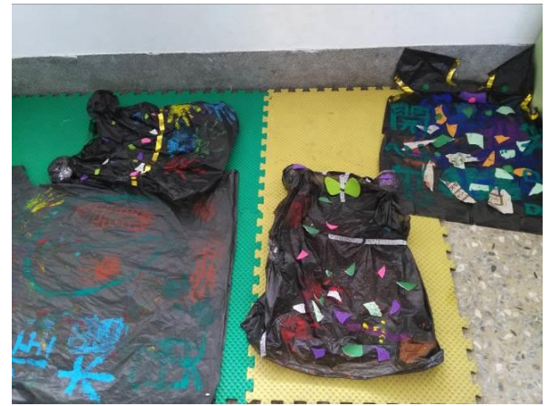
五甲 戲劇表演-自製戲服