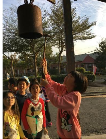
品格村小記者活動