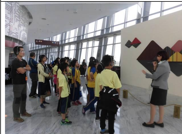
縣內微旅行-故宮南院