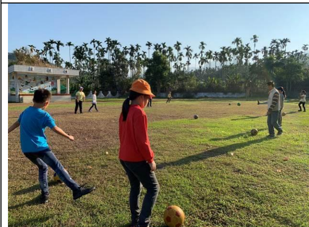
每週四運動社團-高年級