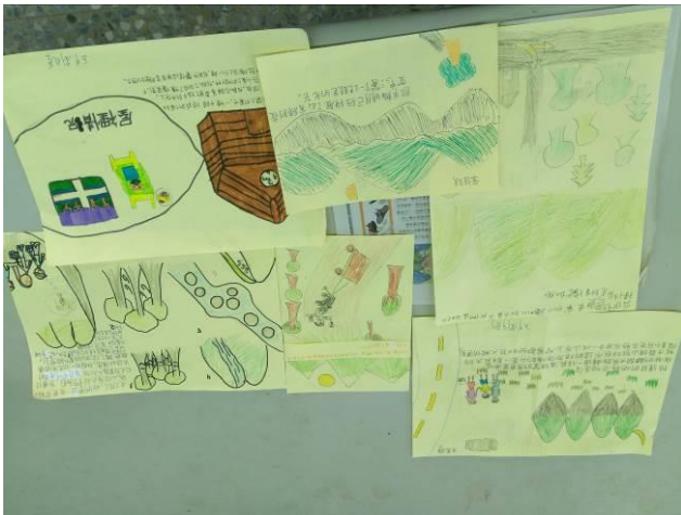
五甲 國語 第14課 小樹之歌 課文想像圖