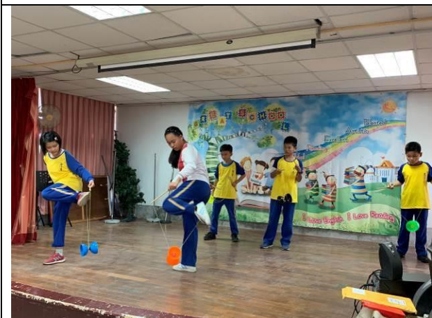
歲末感恩活動-扯鈴表演