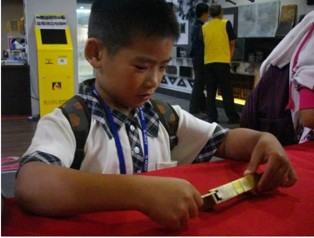
高雄科學工藝博物館~校外教學~解鎖