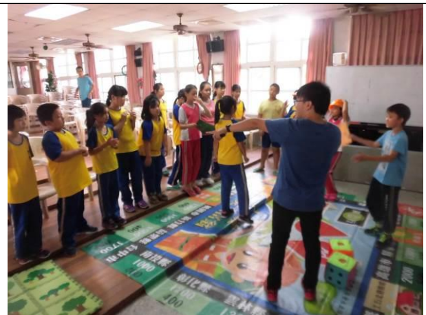
水土保持-土石流防治宣導