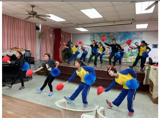
歲末感恩活動-高年級舞蹈表演