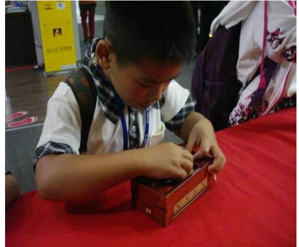
高雄科學工藝博物館~校外教學~解鎖