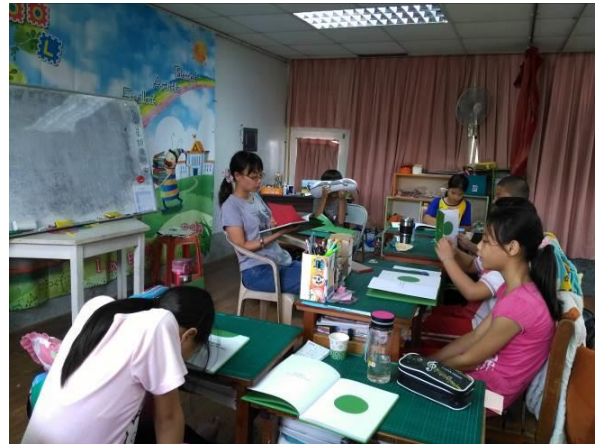
班級共讀-世界屬於你 一書