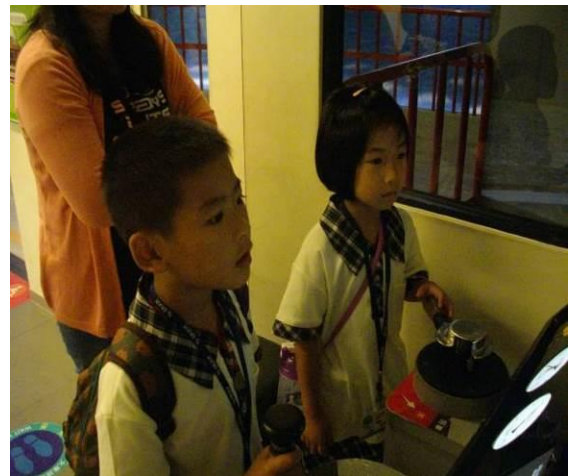
高雄科學工藝博物館~校外教學~開火車體驗