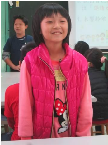
品格村自我介紹活動