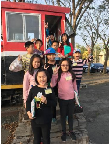
品格村小記者活動