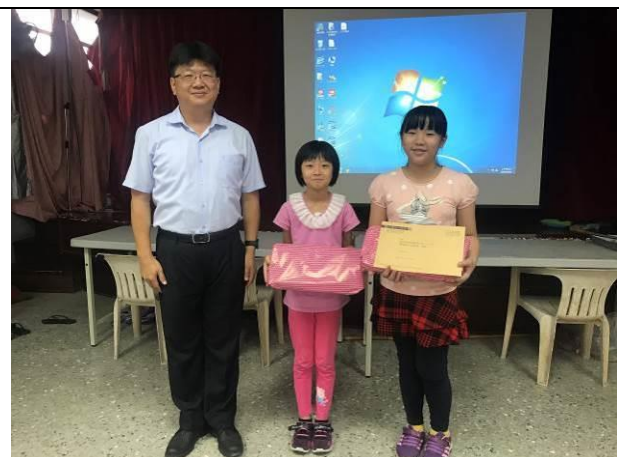
國語日報獲刊頒獎