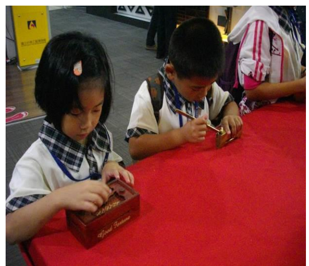
高雄科學工藝博物館~校外教學~解鎖