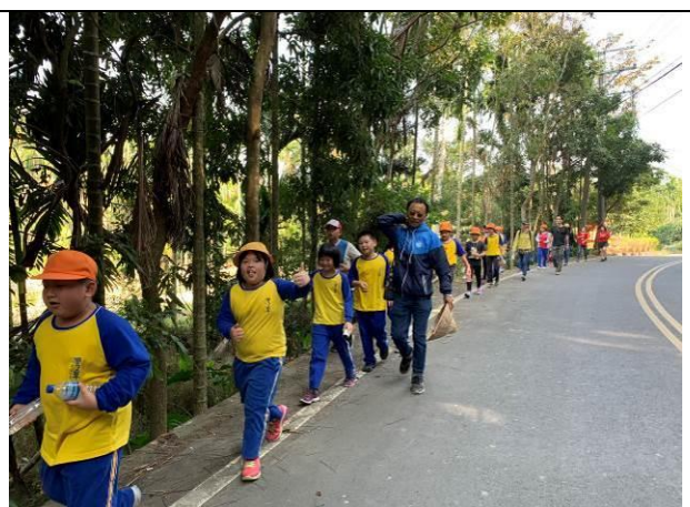
歲末感恩活動-綠盈牧場社區踏青