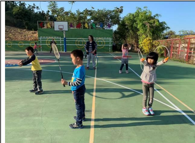
每週四運動社團-低年級