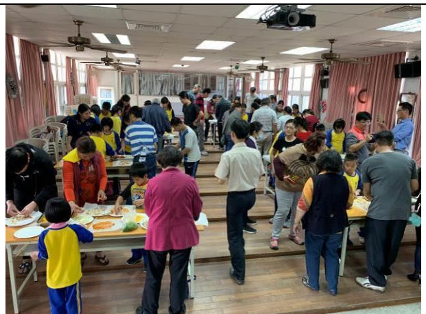
歲末感恩活動-親子手做 pizza