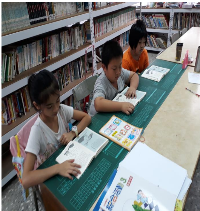
班級共讀-林海音奶奶 80 個寓言