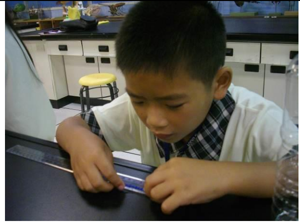
高雄科學工藝博物館~校外教學~製作小烏賊