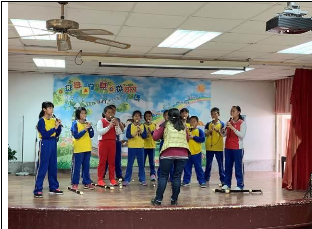
歲末感恩活動-直笛表演