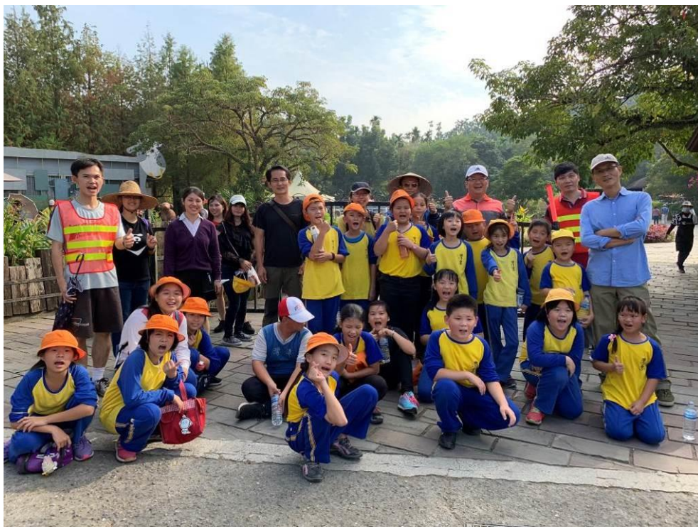
灣潭國小 107 學年度歲末感恩活動—綠盈農場社區踏青合影