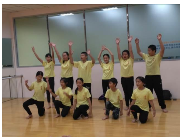
研揚基金會活動-身體開花