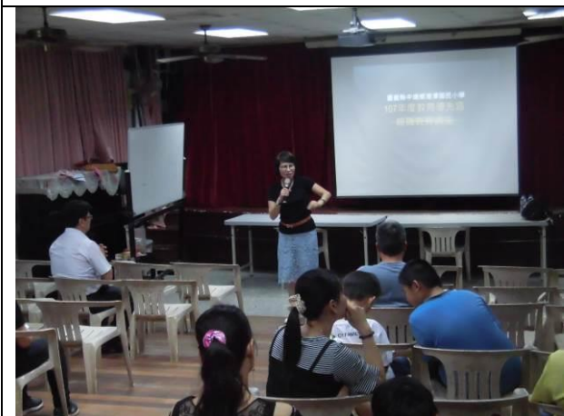
家長日親職教育講座