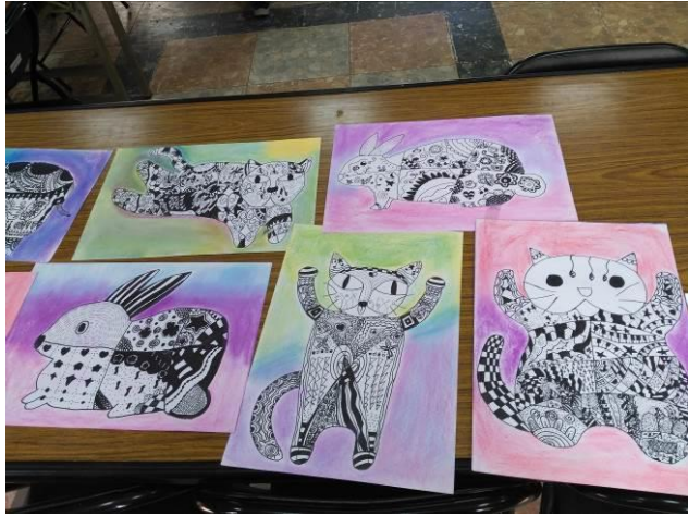
五甲藝術深根 纏繞畫作品