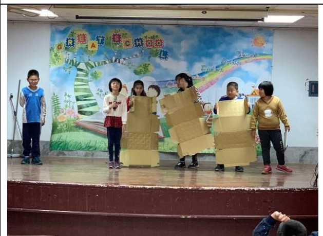
環境教育宣導短劇-北極熊的命運