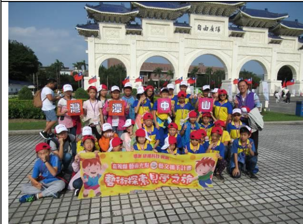
研揚藝術探索見學之旅