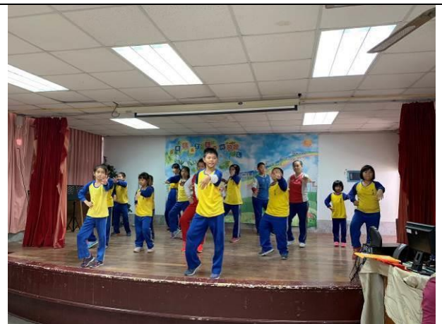
歲末感恩活動-舞蹈表演