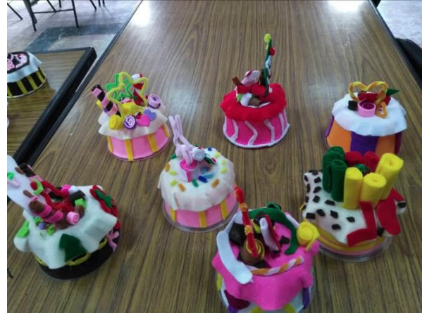
五甲藝術深根 蛋糕作品