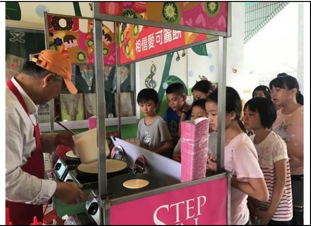
偏鄉小學可麗餅活動