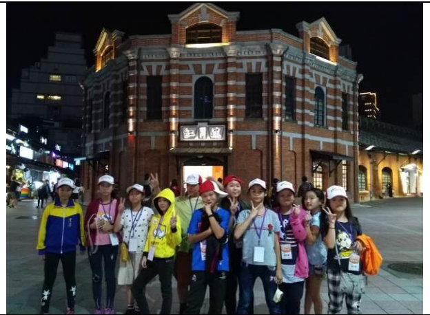
研揚藝術探索見學之旅