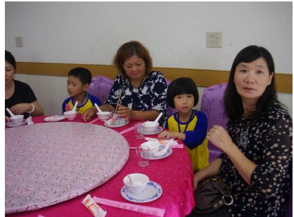
校外教學~故宮. 太陽館~~用午餐