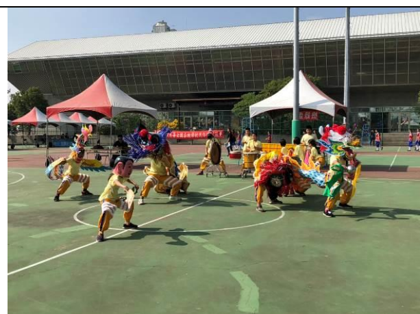
參加全國民俗體育競賽