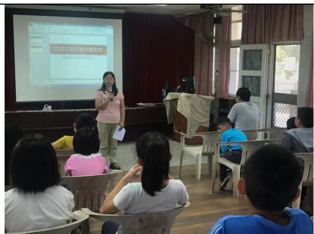
校園空氣品質防護宣導