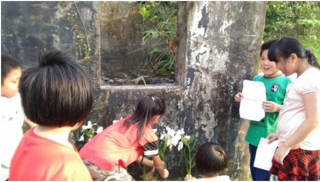
感恩惜字~惜字亭介紹