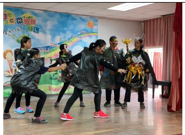
歲末感恩活動-五年級戲劇表演