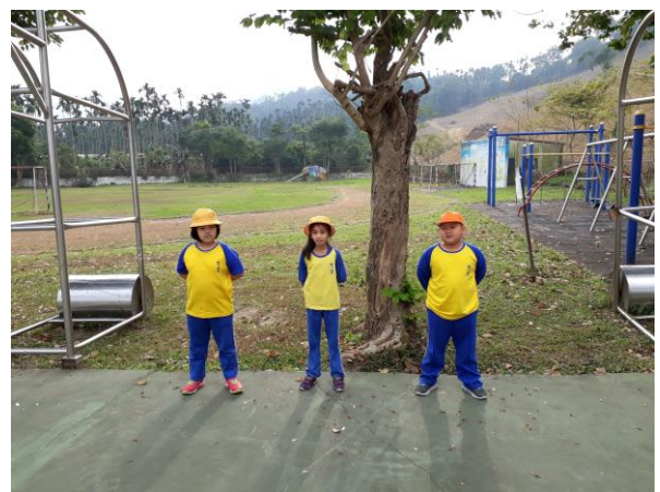
經詩朗誦及英語每周一句