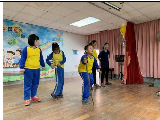
歲末感恩活動-三年級戲劇表演