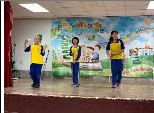
歲末感恩活動-四年級戲劇表演