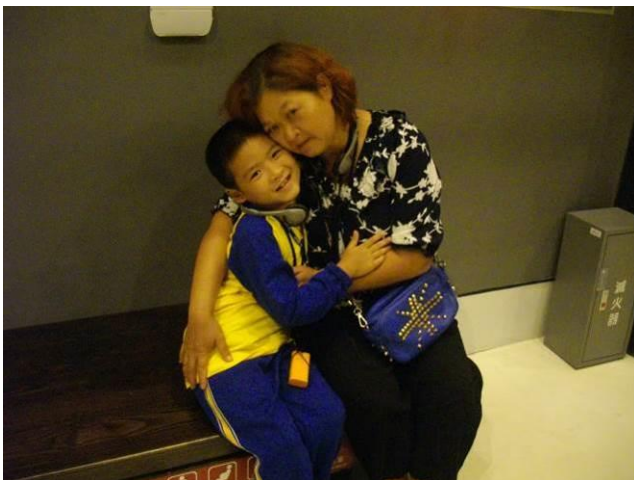
校外教學~故宮. 太陽館~~嬭孫情