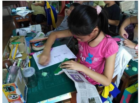
認識報紙-刊名、標題、報頭...