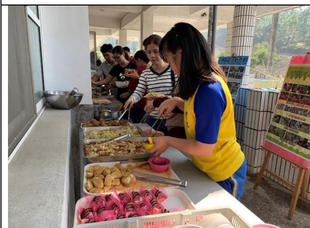
歲末感恩活動-溫馨午餐時間