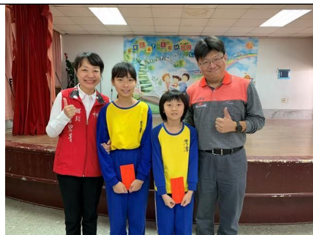
歲末感恩活動-中埔鄉李碧菁鄉長蒞校指導、頒獎