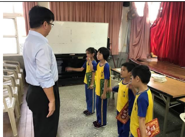
每週整潔秩序比賽頒獎