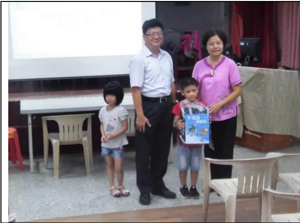
107 學年度開學典禮新生贈書、書包、餐具