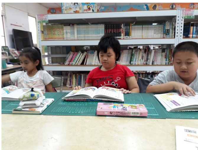
班級共讀-成語故事