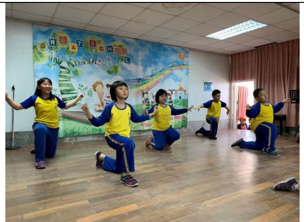
歲末感恩活動-中年級舞蹈表演