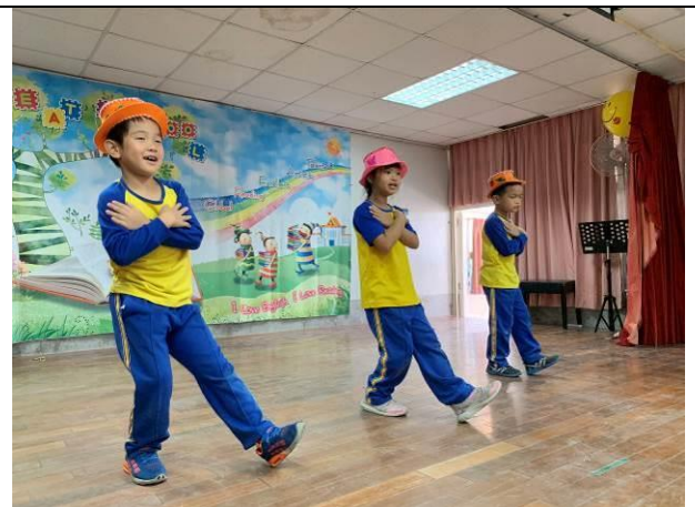
歲末感恩活動-二年級舞蹈表演