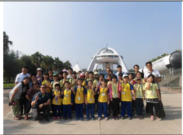
縣內微旅行-北回歸線太陽館