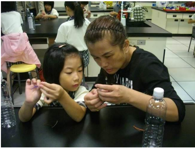
高雄科學工藝博物館~校外教學~製作小烏賊