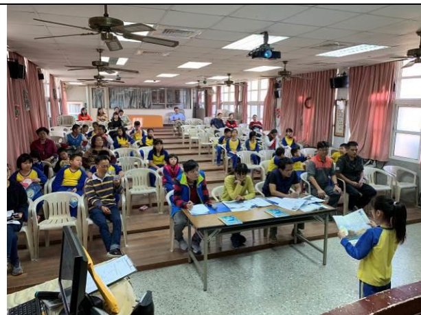
歲末感恩活動-朗讀比賽