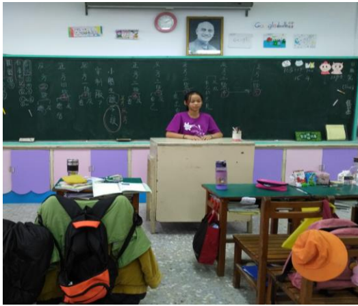
法治教育 小學生該不該穿制服 辯論