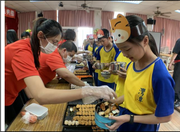
爭鮮壽司美食體驗活動