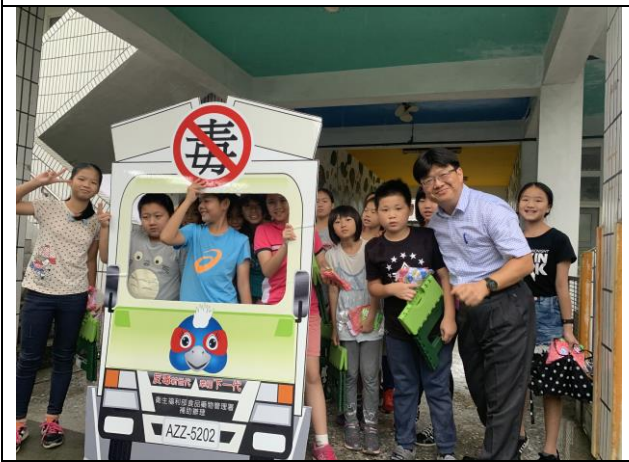
反毒宣導車到校宣導