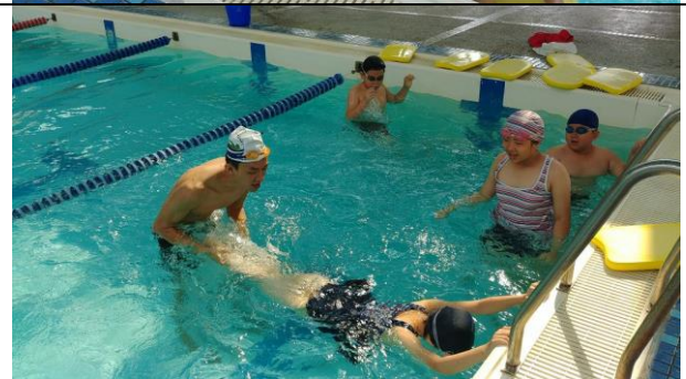
為期六次的游泳教學-鹿草焚化爐游泳池