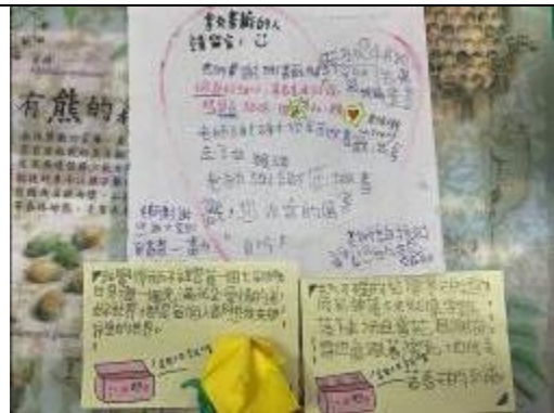
你們的留言真的是最棒的禮物與驚喜！ 「沒事多留言，多留言，好事就發生了！」