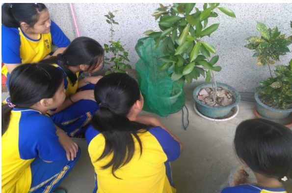
校本課程-無尾鳳蝶羽化了