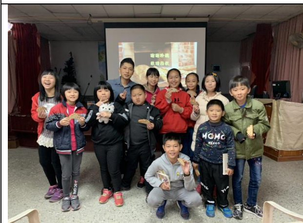
藥物濫用防治宣導