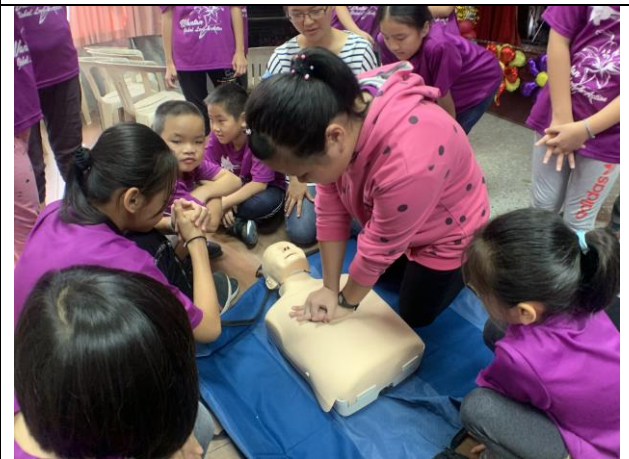
學生 CPR 演練操作