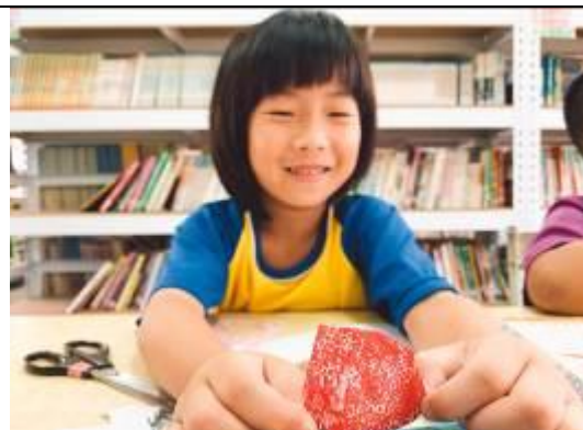
這是我自己拓印的~