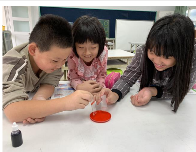
自然課-水的移動單元實驗