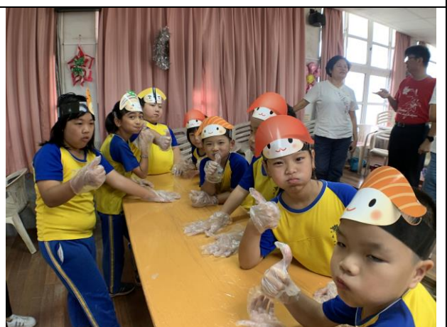
爭鮮壽司美食體驗活動