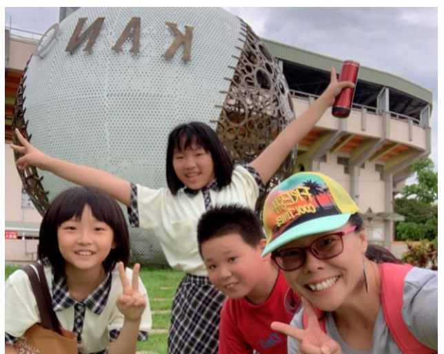
社會課戶外教學-中山公園