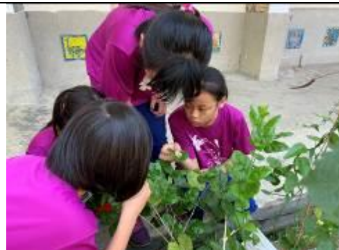
ㄟ•！那聞香瓶味道很像茉莉花香ㄟ