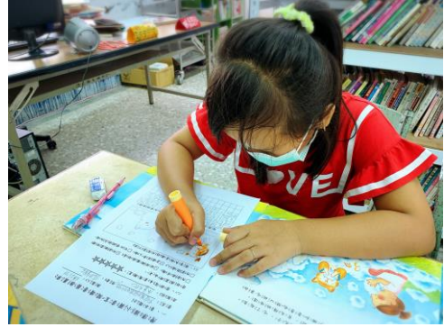
參加圖書室活動-圖書推薦單