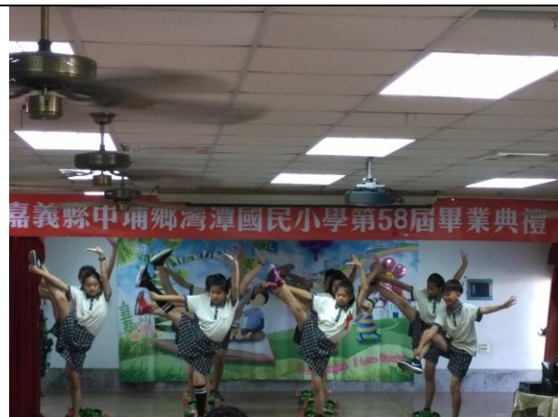
第 58 屆畢業典禮-表演節目