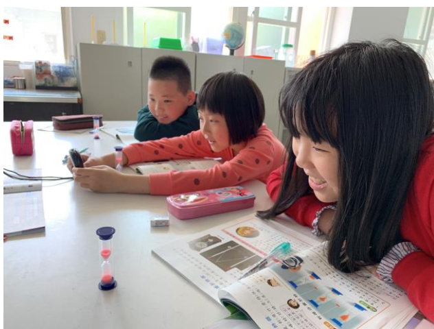
自然課-時間單元-用沙漏計時