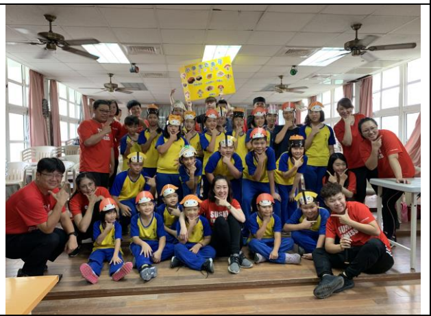
爭鮮壽司美食體驗活動