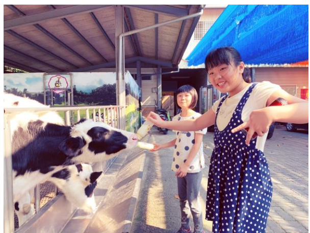
獨角仙農場體驗餵牛喝ㄋㄟ ㄋㄟ