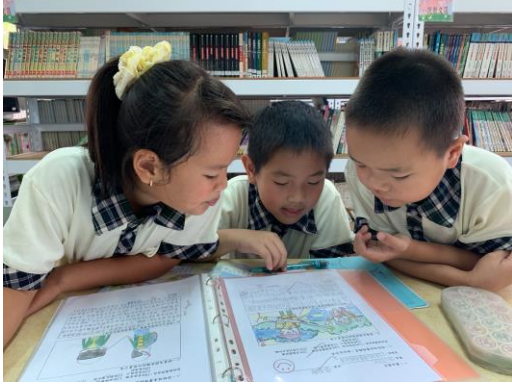
欣賞別人的優秀作品