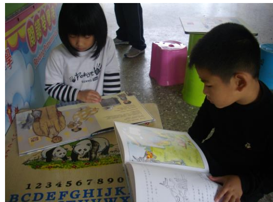
行動圖書車到校~~閱讀