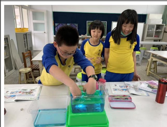
自然課-水的移動單元實驗