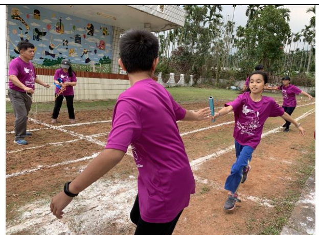
58週年校慶大隊接力賽