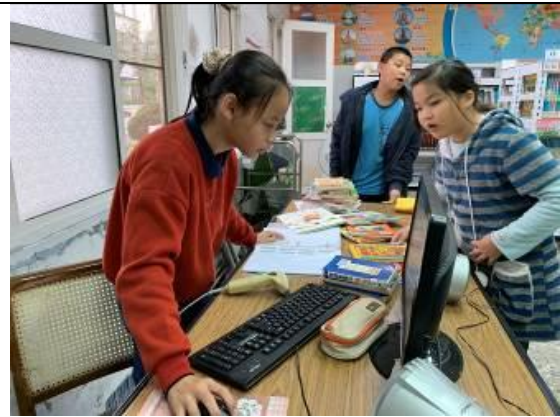
專注為人服務的妳最美麗