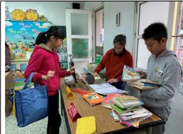
認真的圖書小志工