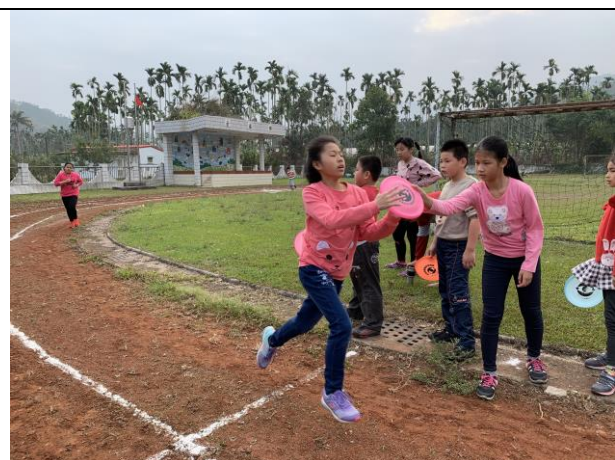
期初 800 公尺測驗