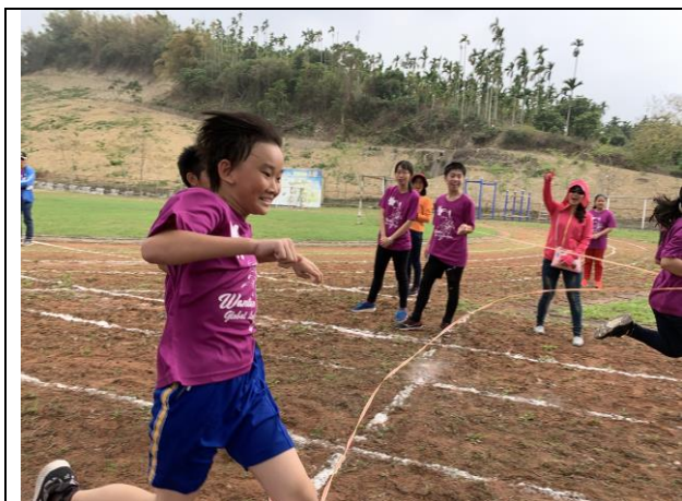
58週年校慶高年級 60 公尺比賽