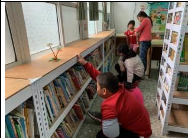
大夥兒很認真的參與找書活動！