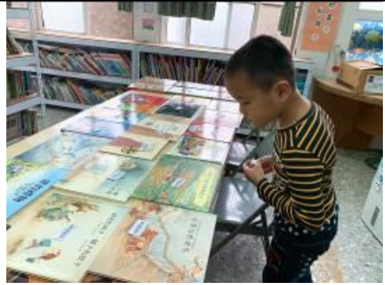
謝謝你幫了老師一個大忙~書標配對