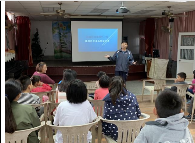
檳榔菸害毒品防制宣導