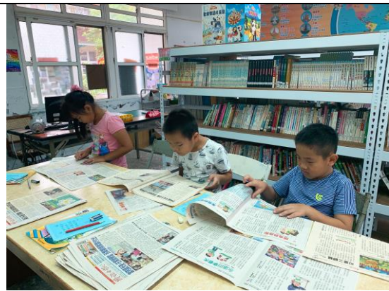
認真找文章，參加「畫話」活動，喜歡看你們認真的模樣！