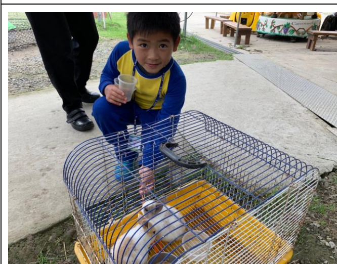
校外教學~台南樹谷