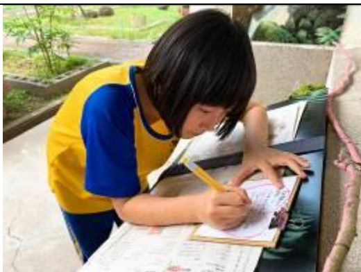
留言給老師，謝謝您的書籤！（謝謝妳的留言）