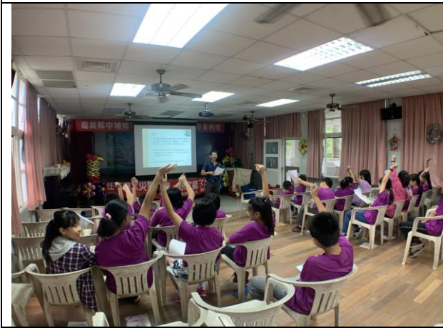
消防隊水域安全宣導