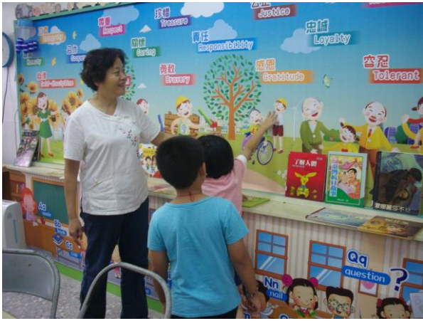
認識圖書室~認識圖文