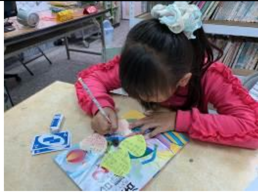
再寫給一個圖書小志工就完成了！耶~