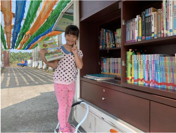
行動書車閱讀活動