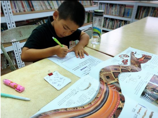
參加圖書室活動-圖書推薦單