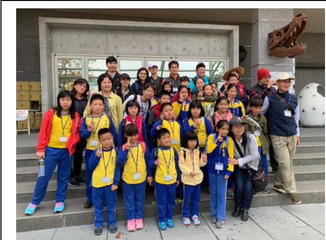
校外教學~台南樹谷