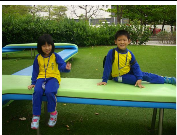
校外教學~台南樹谷