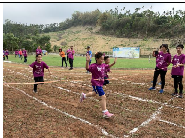
58週年校慶低年級 60 公尺比賽