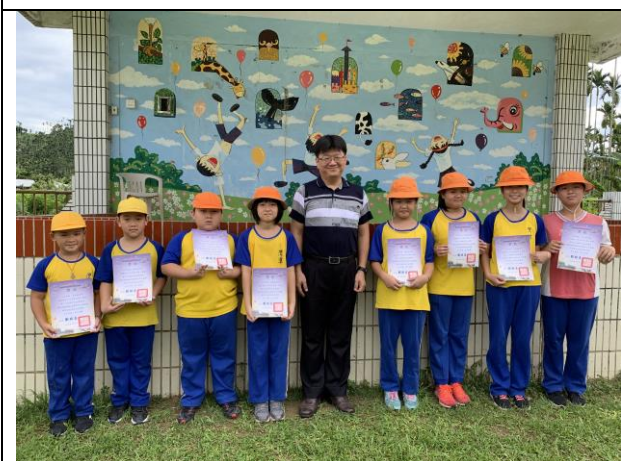
第二次月考成績優異頒獎