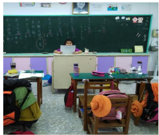
法治教育 小學生該不該穿制服 辯論