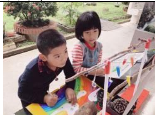
這是一個發揮想像力的彩色活動