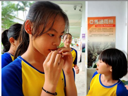
現在，我們擁有了相同的回憶！