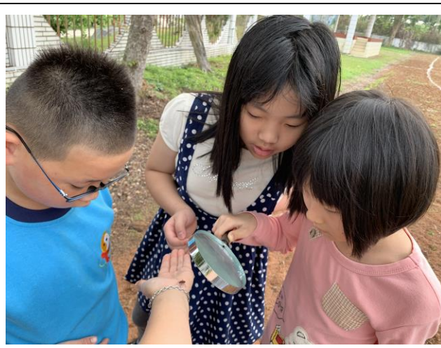
自然課-校園觀察昆蟲