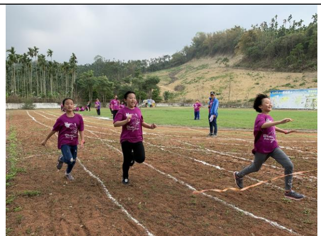
58週年校慶中年級 60 公尺比賽