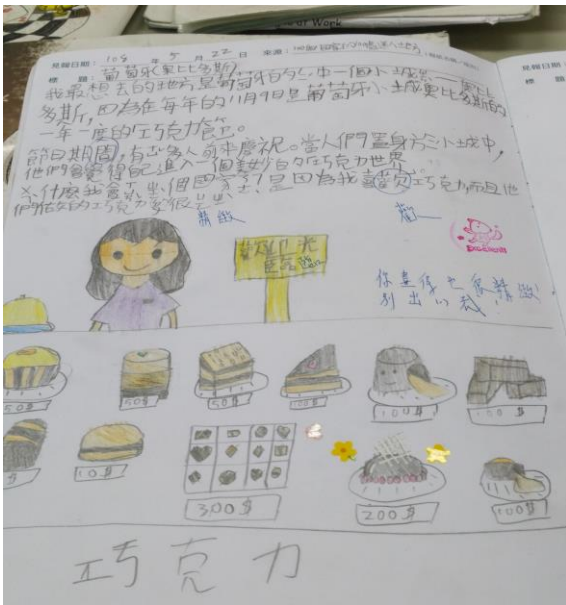
班級共讀-100 個世界上有趣的地方 畫出有趣地點想像圖