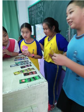
校本課程-蝴蝶魔法牌遊戲