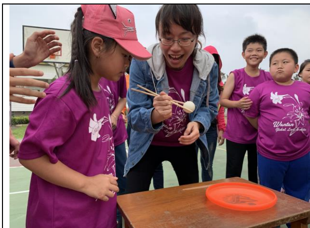
58週年校慶趣味競賽