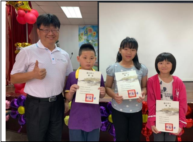
投稿文章獲刊頒獎