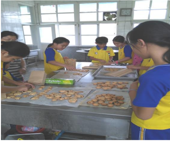
母親節活動-製作手工餅乾