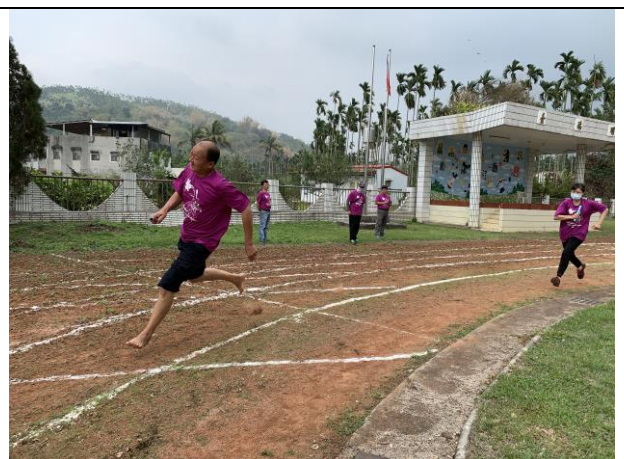
58週年校慶大隊接力賽家長同樂