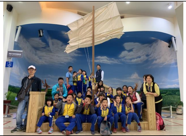
倒風內海校外教學合影