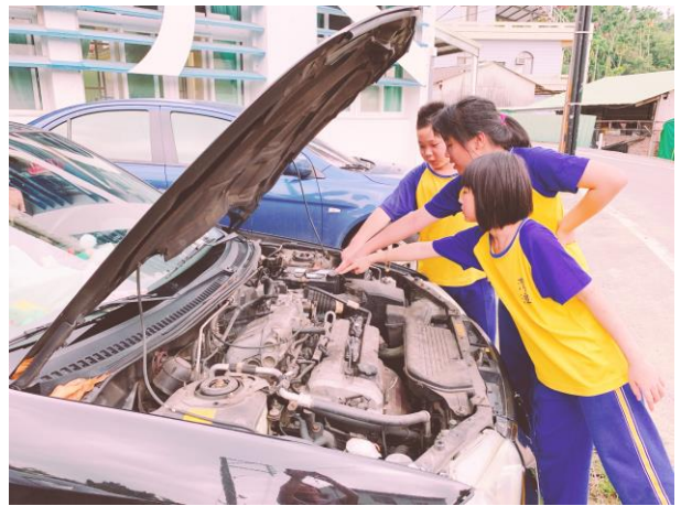
自然課-找一找汽車電瓶