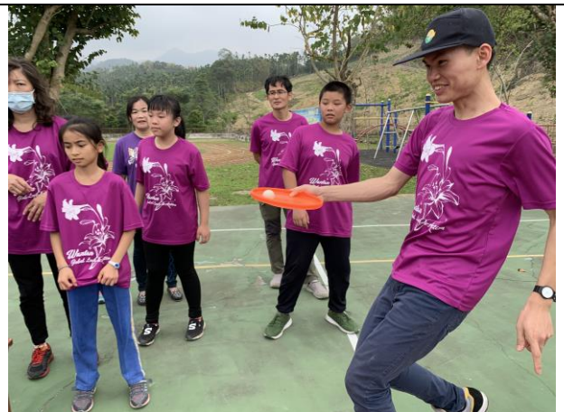
58週年校慶趣味競賽