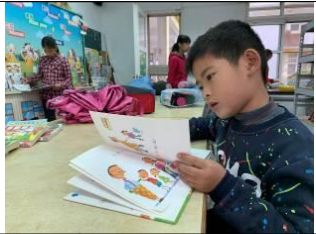
圖書室的書真好看，看我的表情就知道！