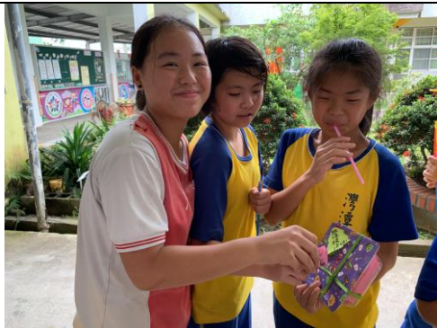
投進去的紙條，不只是紙條，是……