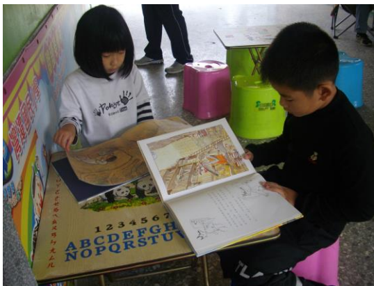
行動圖書車到校~~閱讀