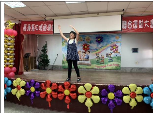
英語日學藝競賽賽前練習