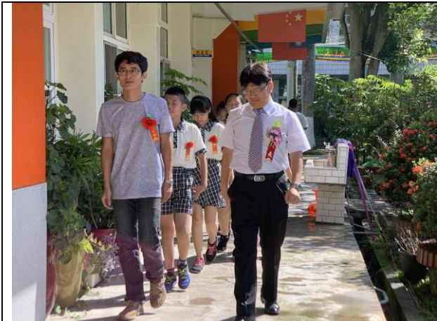
第 58 屆畢業典禮畢業生回顧校園