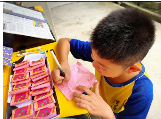
謝謝每個活動都參加的「智哥」，我會把感動放在心中，不忘！祝你畢業快樂！平安健康長大