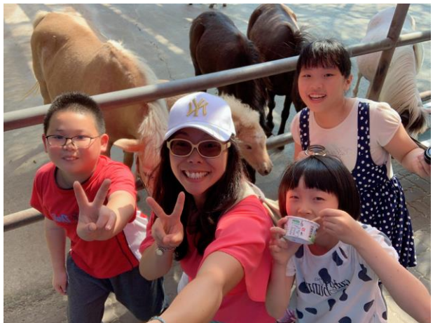
社會課戶外教學-獨角仙農場