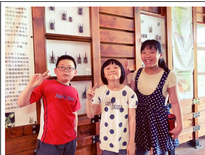
獨角仙農場內參觀昆蟲館