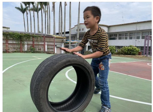
體育課滾輪胎趣味活動