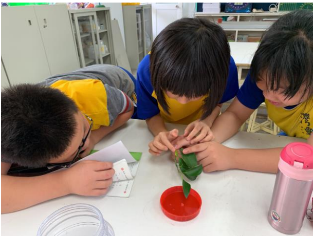
自然課-昆蟲世界單元-觀察無尾鳳蝶幼蟲