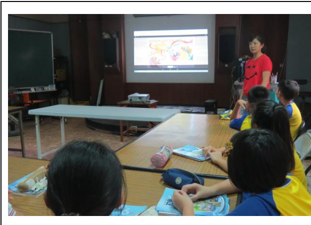
家長入班反毒宣導