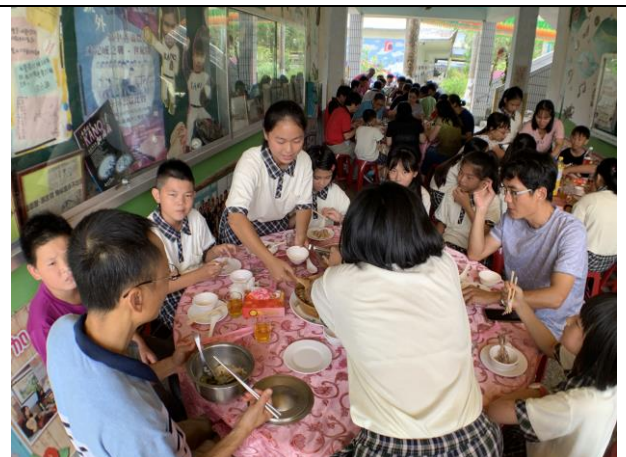
第 58 屆畢業典禮-餐敘