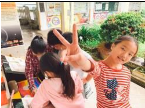
這個角度、手勢和笑容都美到不行~