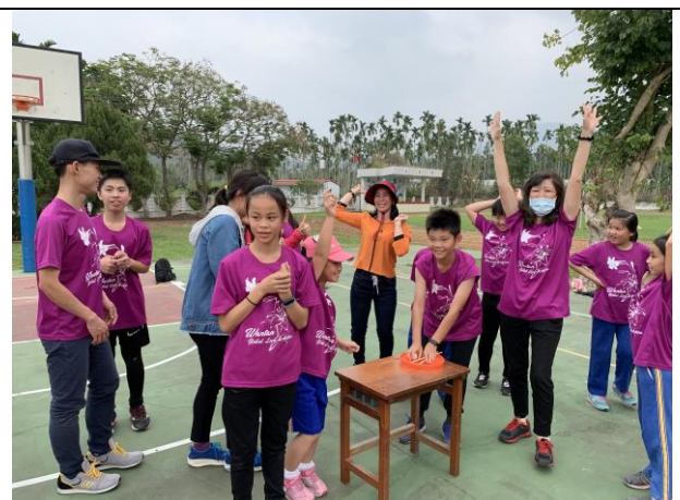
58週年校慶趣味競賽獲勝歡呼