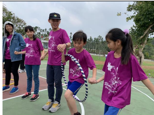
58週年校慶親子趣味競賽