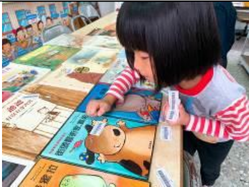
老師會記住，棋棋是第一個協助書標配對的人