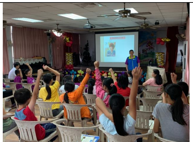
性別平等教育宣導