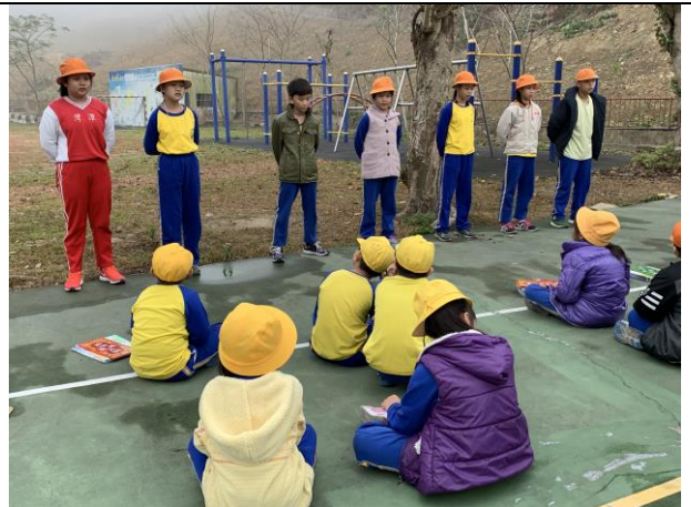
學生朝會經詩朗誦