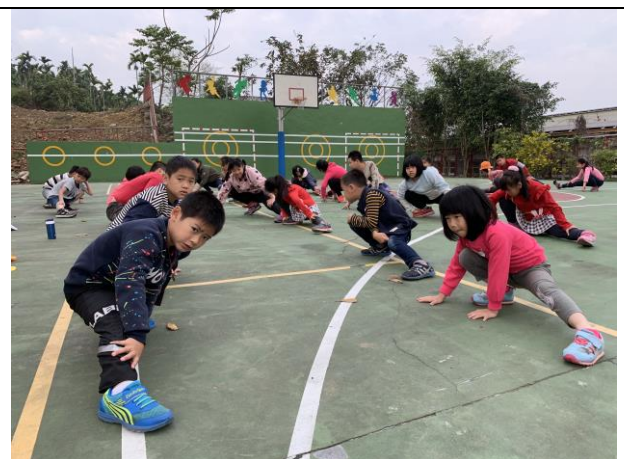
每週四晨間運動社團前熱身