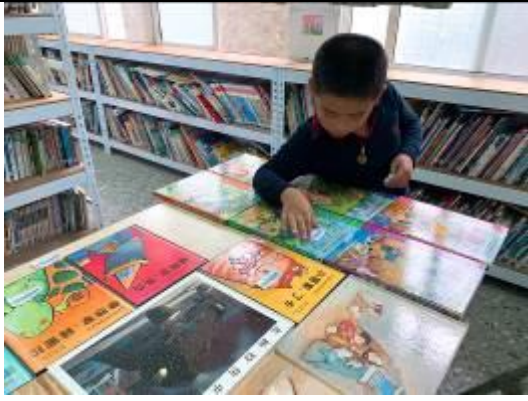
我小一，但我會幫忙編書！老師說我很厲害！