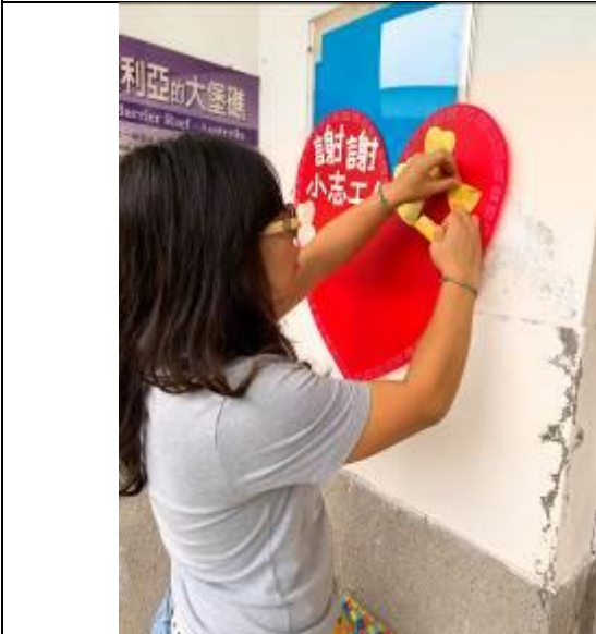
辛苦佈置活動的老師(自己說自己辛苦,哈哈)