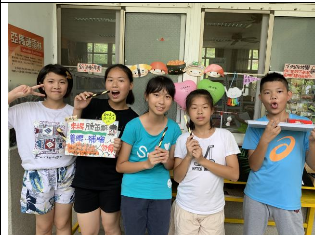
給畢業生的祝福小禮-能量脆笛酥