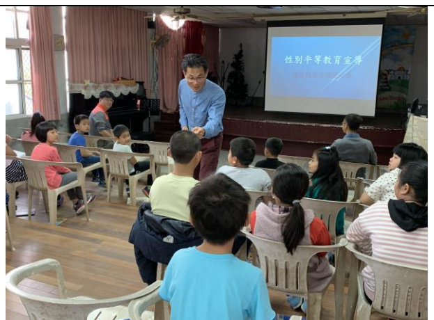
性別平等教育宣導