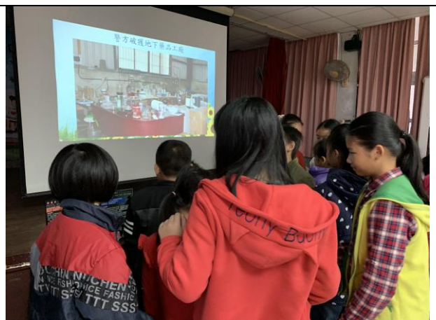
藥物濫用防治宣導