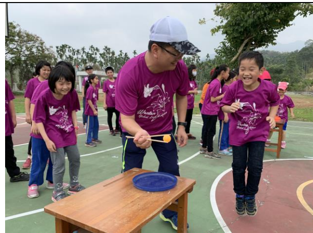
58週年校慶親子趣味競賽