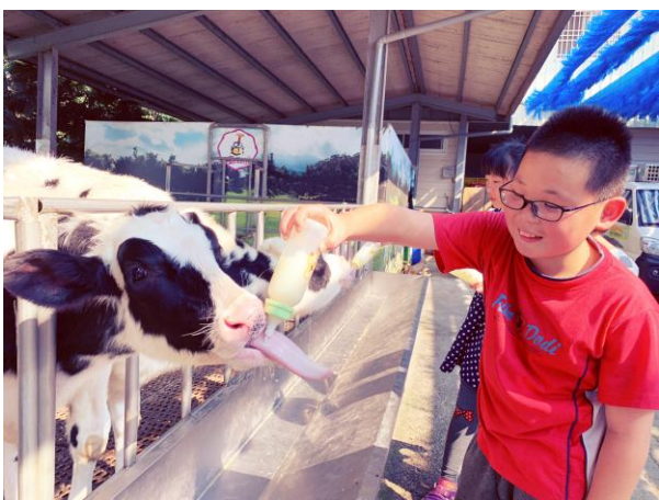
獨角仙農場體驗餵牛喝ㄋㄟ ㄋㄟ