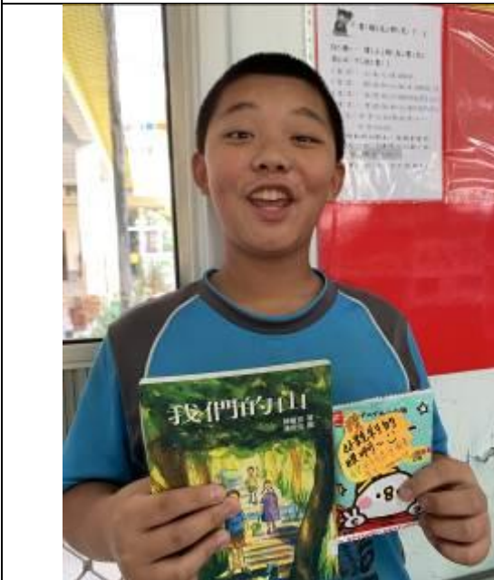
圖書室找書活動，我有銳利的鷹眼！