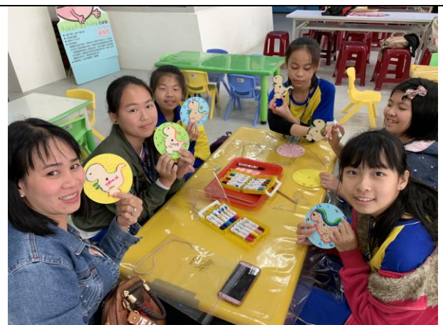
校外教學恐龍時鐘 DIY