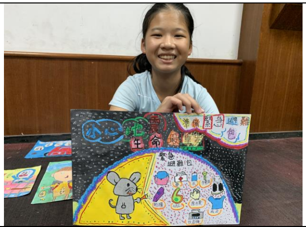
校內地震防災繪畫比賽