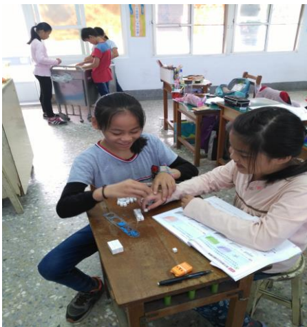
數學課-體積 排積木