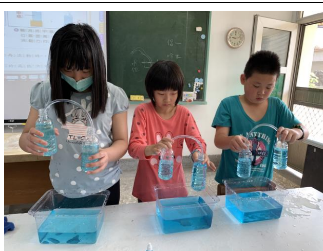
自然課-水的移動單元實驗