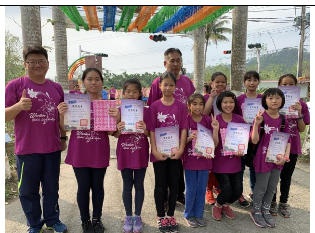
頒發社區小鐵人路跑完賽證書