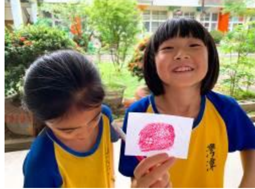
「嗨！你好嗎？」「我很好，希望你也是。」