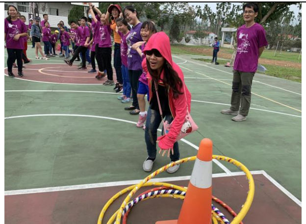
58週年校慶親子趣味競賽