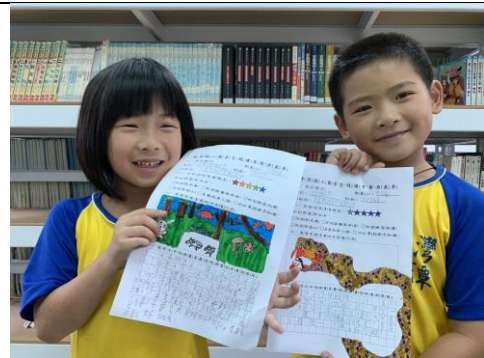
終於完成了推薦單！你們真是資優生啊~哈