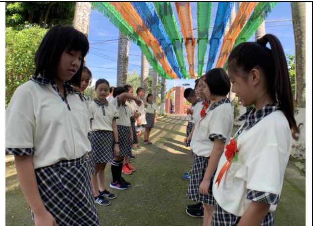
第 58 屆畢業典禮-別畢業胸花