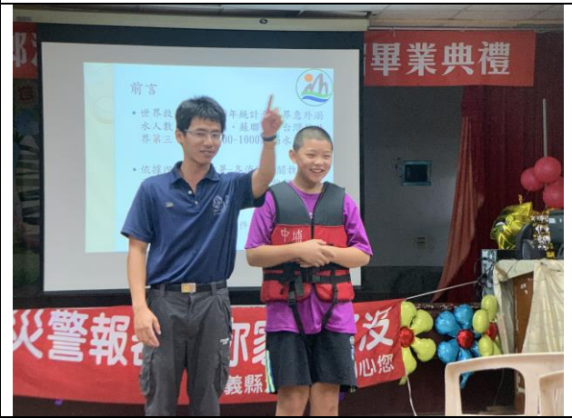
消防隊水域安全宣導