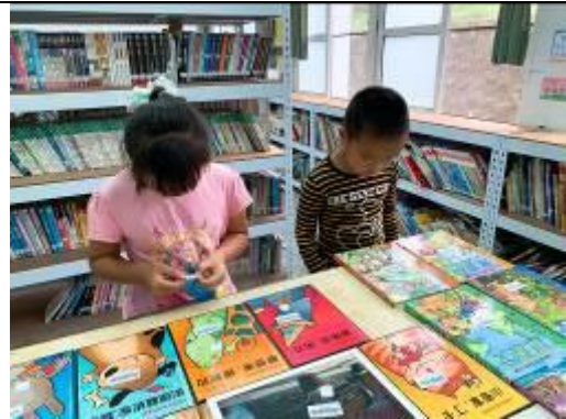
這一批誠品書局的贈書，多虧低年級幫忙找書標！謝謝你們~