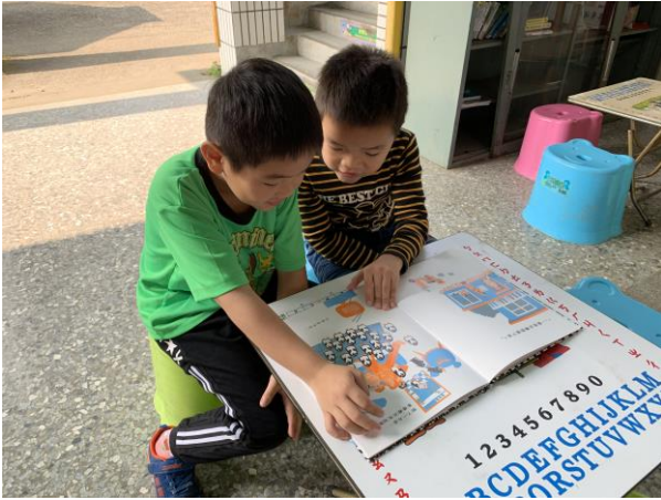
行動書車閱讀活動