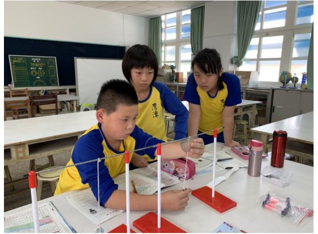
自然課-時間單元實驗