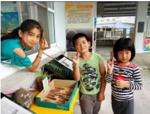
我們選到了喜歡的桃花心木種子，開心~