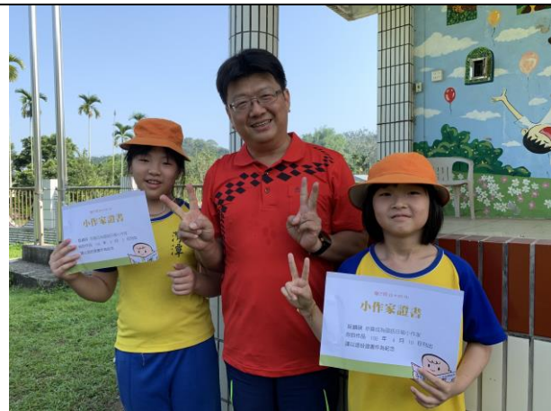
投稿文章獲刊頒發小作家證書