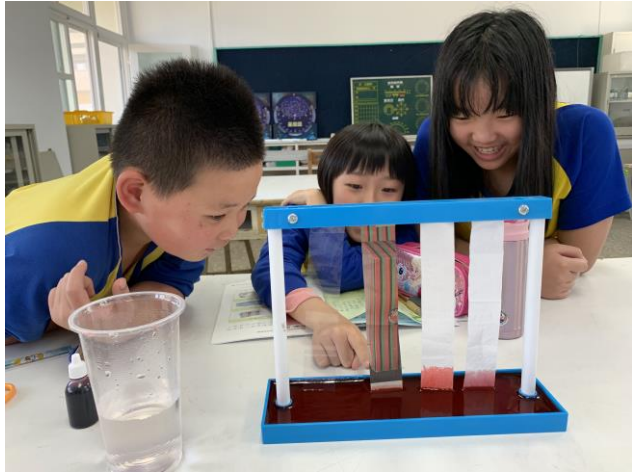
自然課-水的移動單元實驗