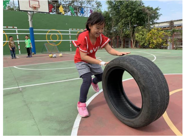
體育課滾輪胎趣味活動