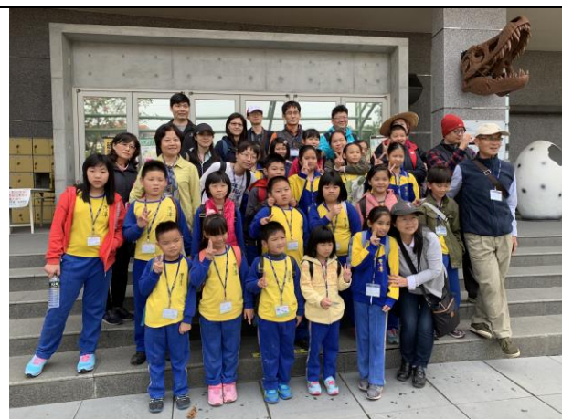
台南樹谷生活科學園區校外教學