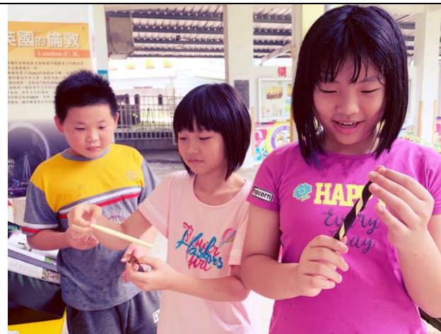
能量脆笛酥裡藏有人生哲理，願你們都充滿正能量