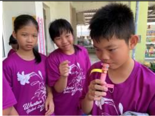
聞香瓶小活動，到底聞出來沒有啦~