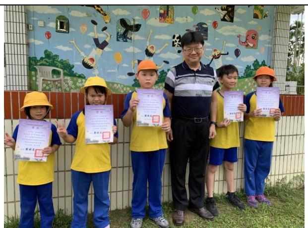
頒發第二次月考進步獎