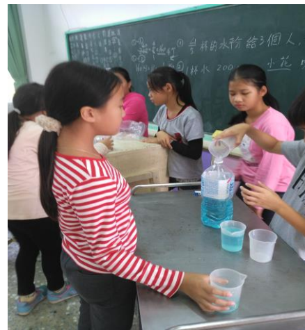
數學課-分數 分成?杯 每杯的容量