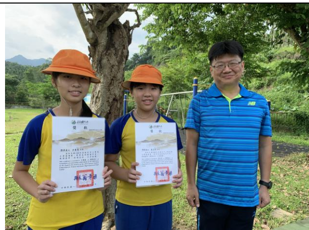
頒發英語學藝日競賽獎狀