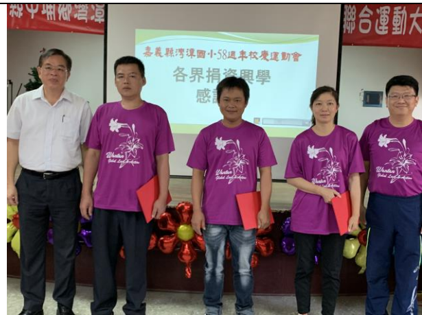
58週年校慶感謝各界捐資興學