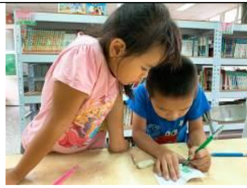
我要用綠色來拓印！