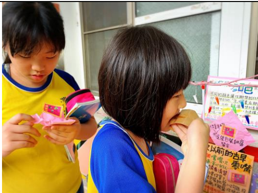
看見你們滿足的表情，就是一種簡單的幸福！