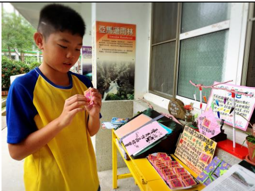
古早零嘴「鹹酸甜」分享活動