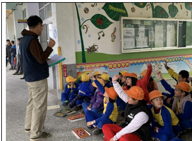
學生朝會-導護老師宣導