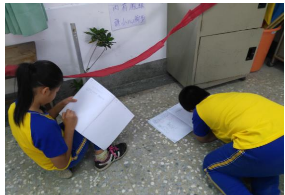
校本課程-觀察無尾鳳蝶的蛹