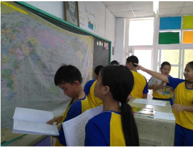
班級共讀-100 個世界上有趣的地方 地圖找國家