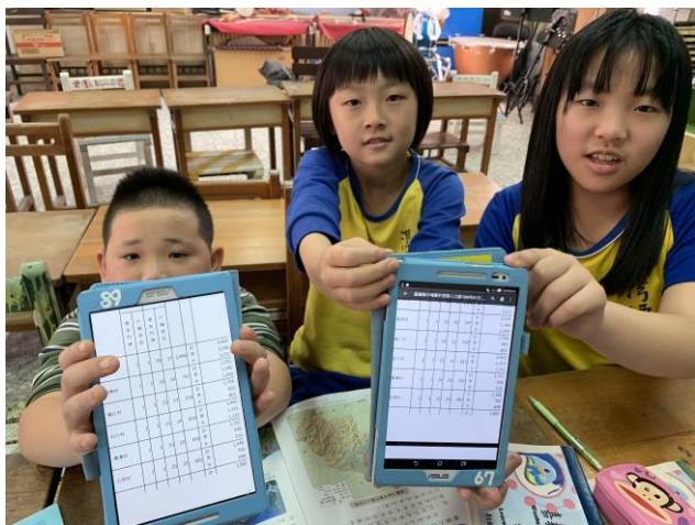
社會課-利用平板上網查詢灣潭村人口數