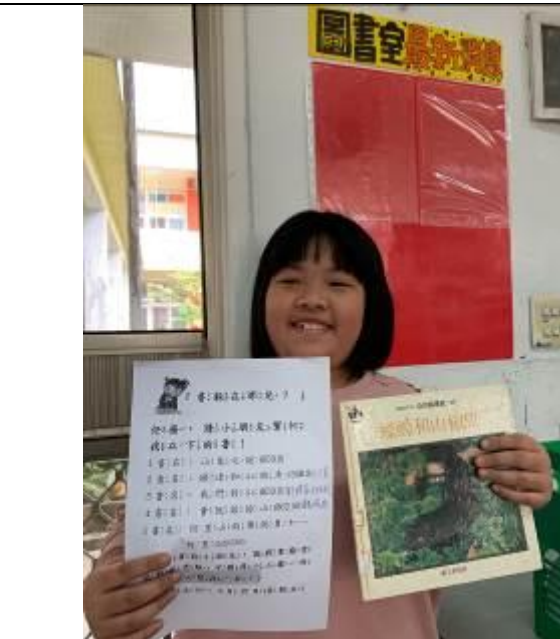
我找到「螻蛄和山椒魚」！