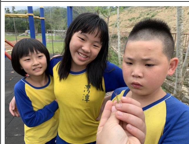
自然課-校園觀察昆蟲