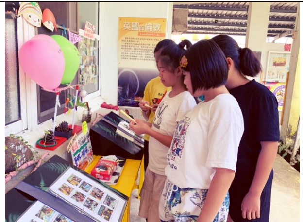
畢業典禮前一天，給畢業生的祝福小禮