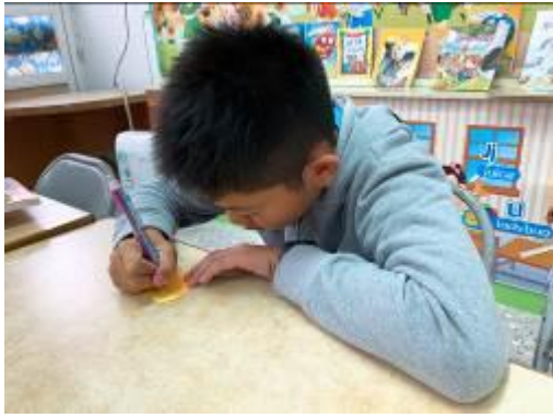
專注寫著給圖書小志工的感謝留言