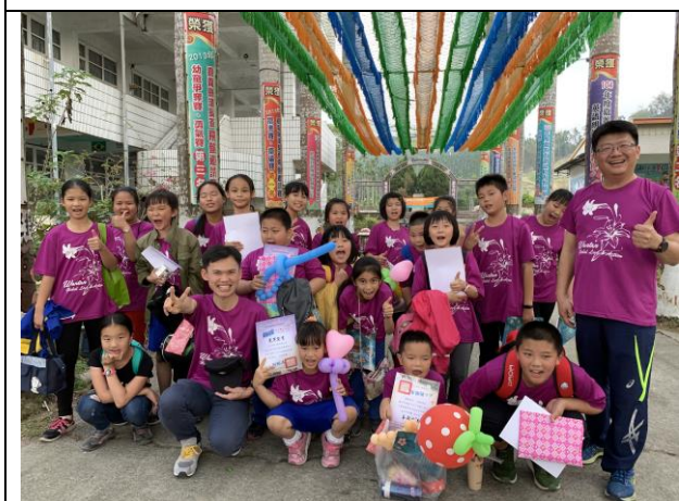
58週年校慶圓滿落幕合影