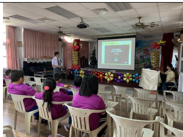
家庭暴力防治宣導