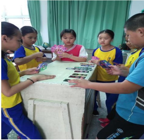
校本課程-蝴蝶魔法牌遊戲