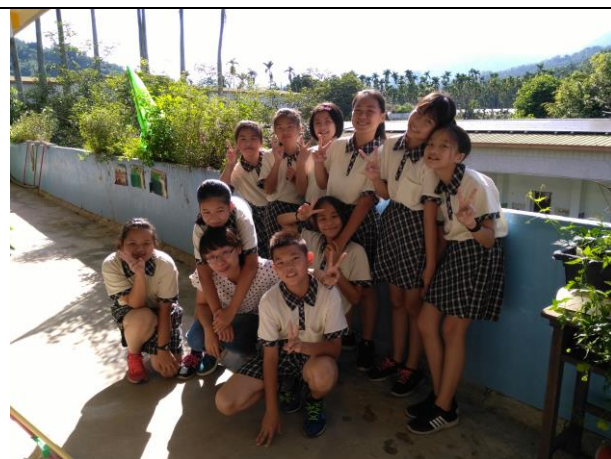
畢業生與在校生留影