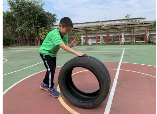
體育課滾輪胎趣味活動