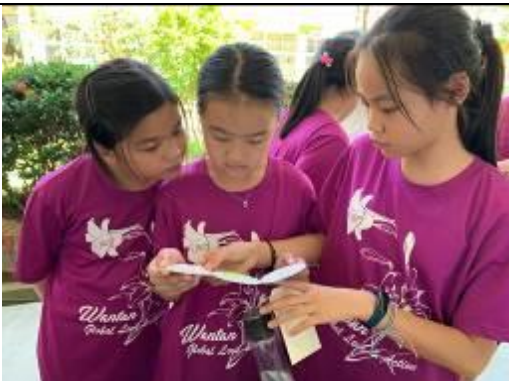
老師的卡片裡頭究竟寫了什麼？來瞧瞧！