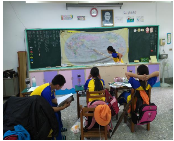
班級共讀-100 個世界上有趣的地方 聆聽同學分享