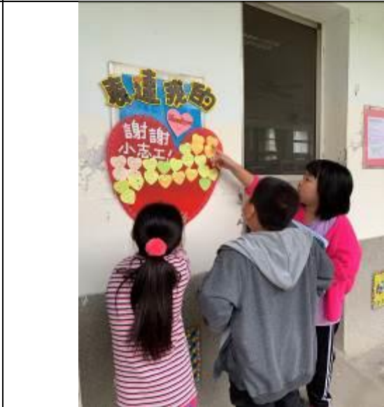
看到圍觀的你們盯著瞧,苦都轉甘甜了!呵