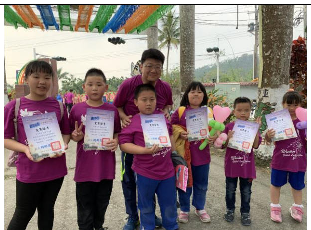
頒發社區小鐵人路跑完賽證書