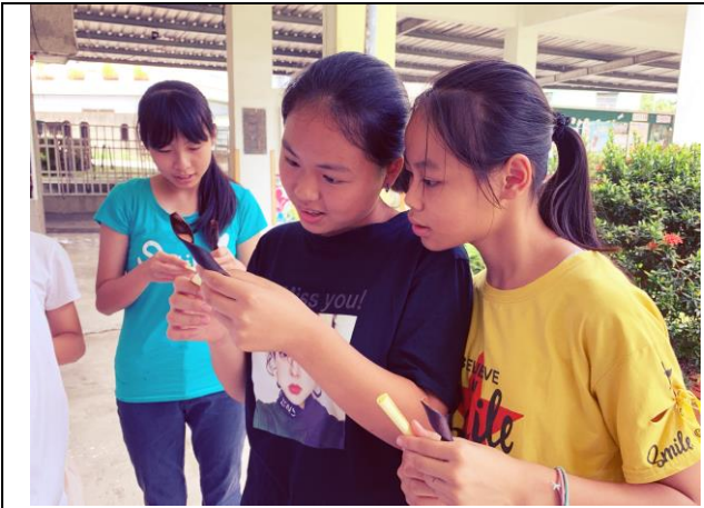
畢業典禮前一天，給畢業生的祝福小禮