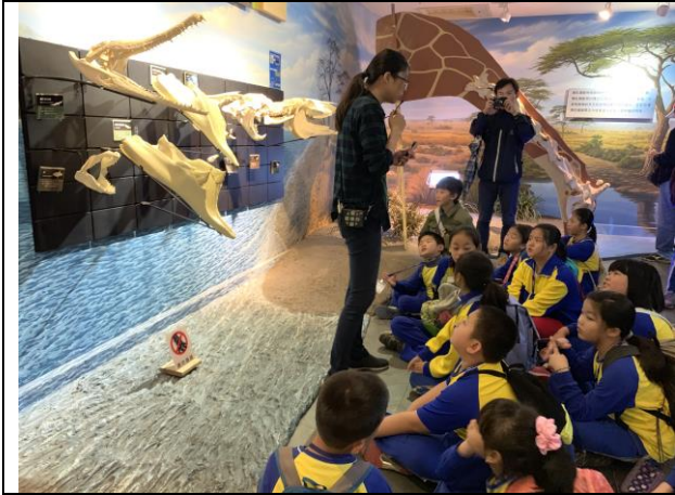
樹谷生活科學園區導覽