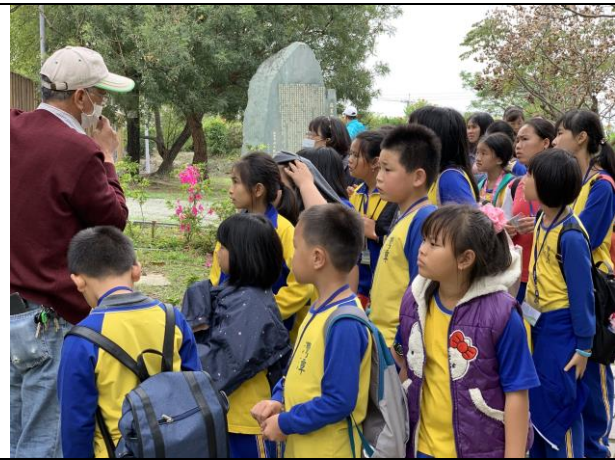
倒風內海園區導覽