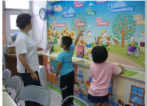
認識圖書室~認識圖文