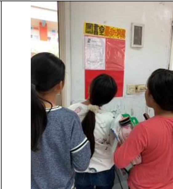
一起看圖書室最新消息！