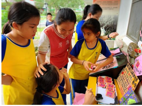
謝謝參加圖書室小互動的你們