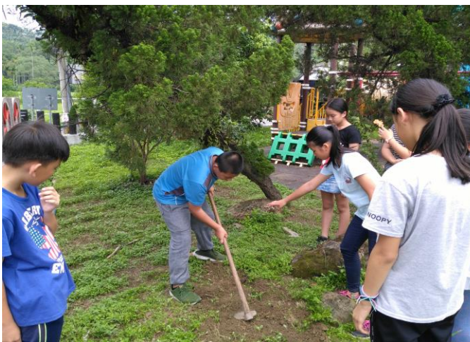
生命教育-埋葬白鼻心