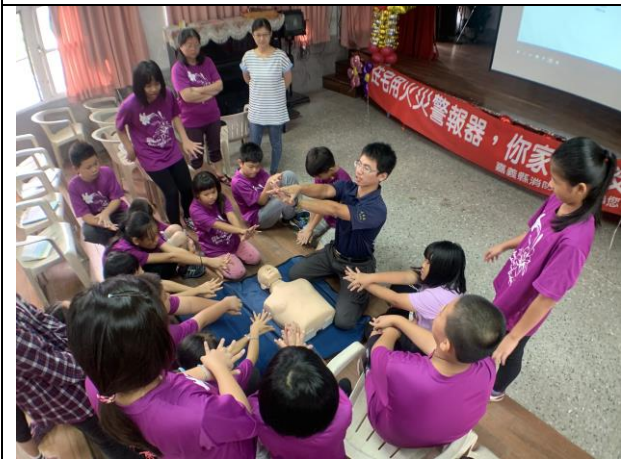
消防隊安全急救宣導