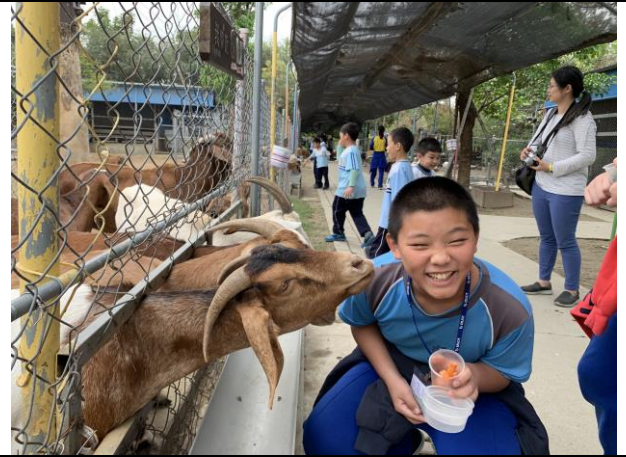
樹谷農場餵小動物體驗