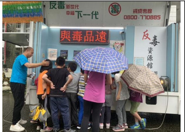
反毒宣導車到校宣導