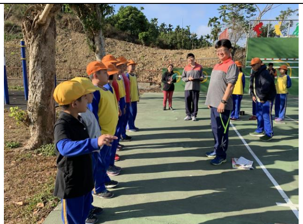
寒假作業優良頒獎