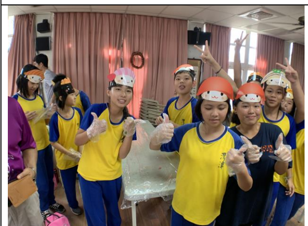
爭鮮壽司美食體驗活動