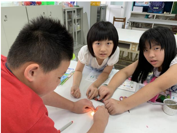
自然課-神奇電力單元實驗