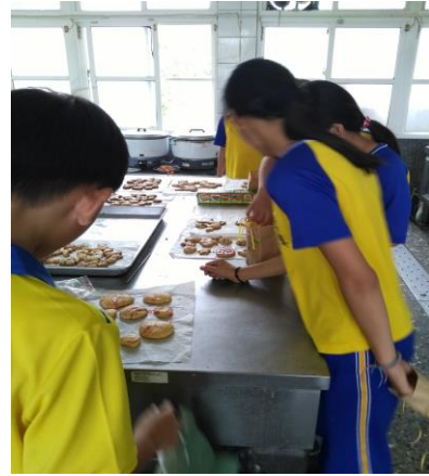
母親節活動-製作手工餅乾