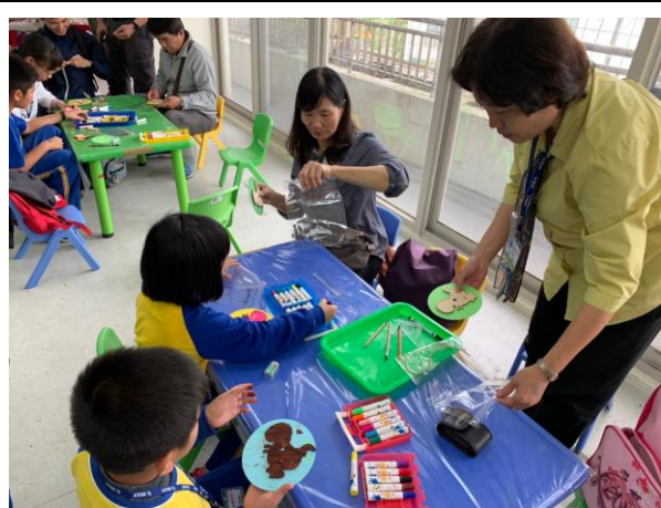
校外教學~台南樹谷 (製做時鐘)