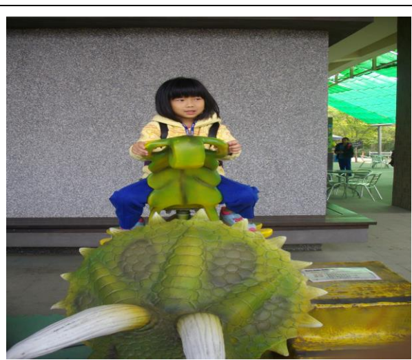
校外教學~台南樹谷