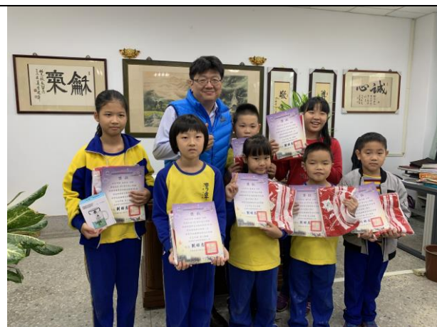
閱讀小專士、借閱排行榜頒獎