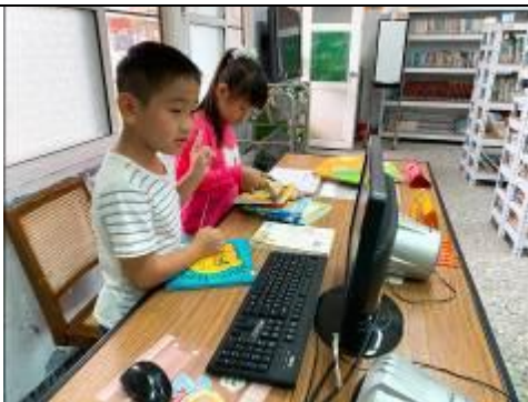
二年級圖書小志工值班