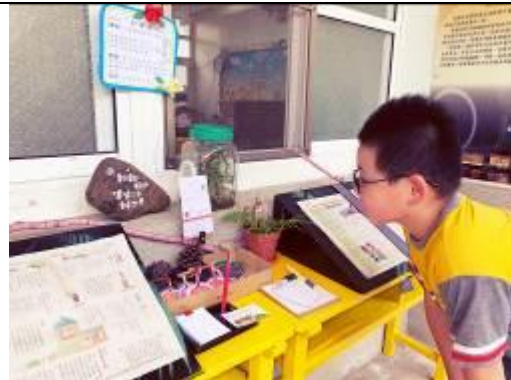
老師又推出什麼新花樣？我來看看！