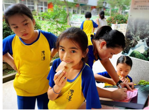
怎麼連吃相都那麼可愛~哈哈