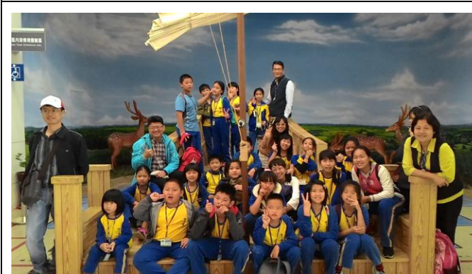
校外教學~台南樹谷 (倒風內海故事館)