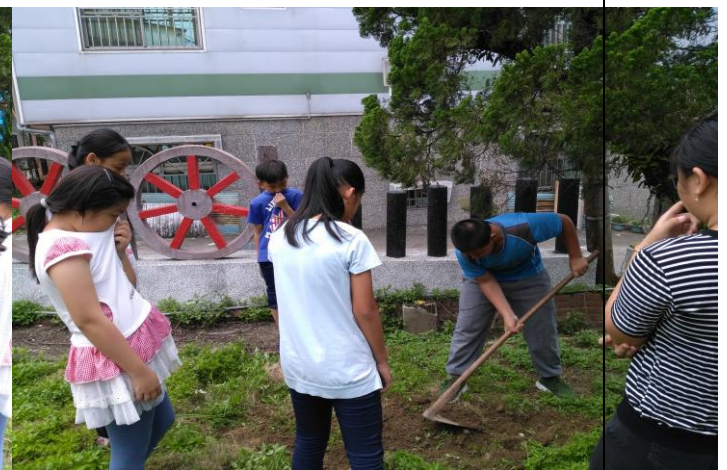
生命教育-埋葬白鼻心