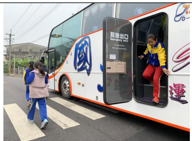
校外教學出發前的逃生演練