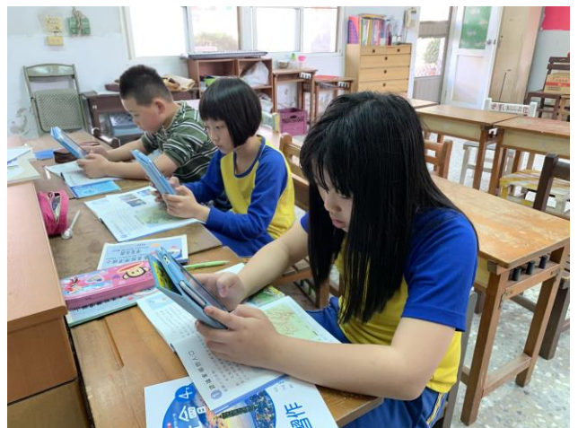
社會課結合資訊教育