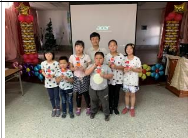
樹谷校外教學學習單摸彩-中獎人合影