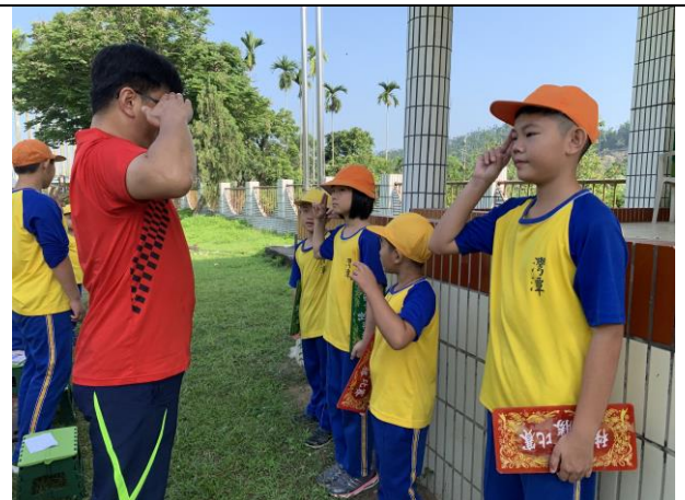
每週一頒發整潔秩序獎牌