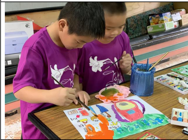
校內地震防災繪畫比賽