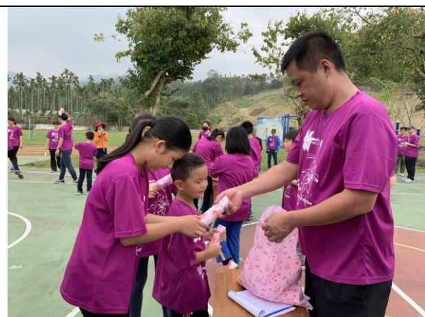
58週年校慶趣味競賽頒發小禮物