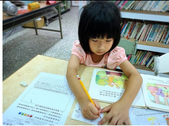
參加圖書室活動-圖書推薦單