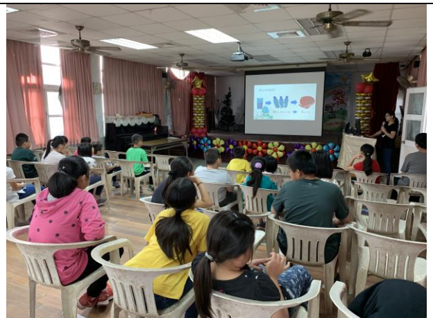
校護進行腸病毒防治宣導