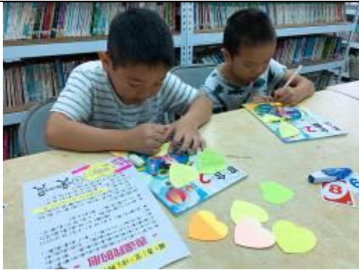
埋頭苦「寫」！既認真又厲害！