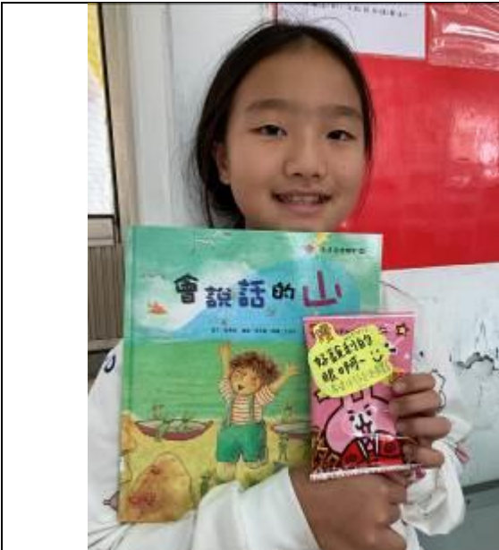
那座「會說話的山」其實是一隻大鯨魚！