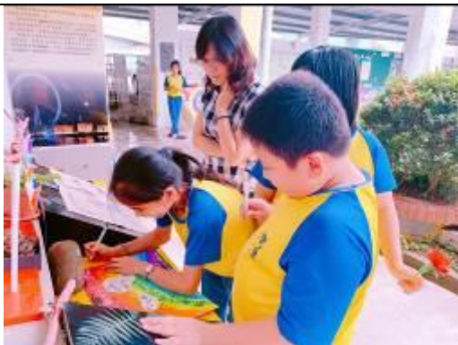
一起聯想顏色的想像