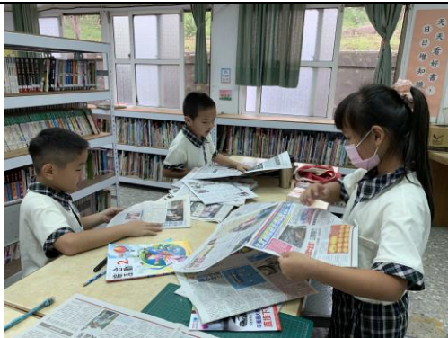
那張「下雨天」的創作，你們幫忙找報紙上的字，真是好厲害！謝謝~