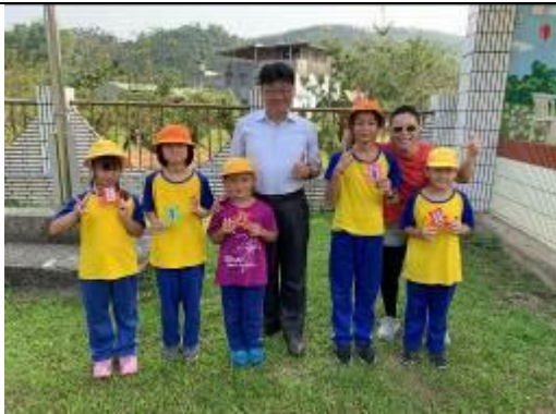
圖書室「表達我的心」留言活動摸彩得獎人